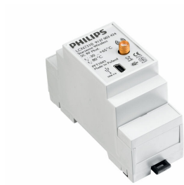
LCN7310/00 Starsense Wireless SC RF mod.