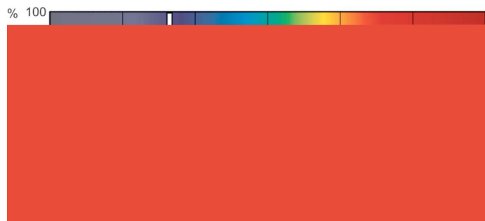
XDPB_XDMSR_SA-Spectral power distribution B/W