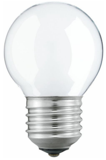
E27, P45, Frosted