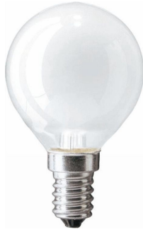
E14, P45, Frosted